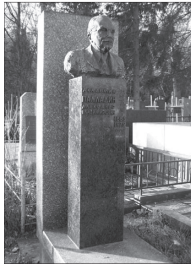
Могила О.В. Палладіна

В Інституті біохімії в 1947 р. В.О. Беліцером зі співробітниками було розроблено теорію та досліджено механізм денатураційних перетворень глобулярних білків. В 1961 р. В.О. Беліцер вперше сформулював кількісну кінетичну теорію, що охоплювала як фазу ферментаційного перетворення фібриногену, так і фазу спонтанної полімеризації мономерного фібрину. З 1952 р. М.Ф. Гулий почав розробляти проблему біосинтезу білка. В 1955 р. Д.Л. Фердманом та ін. було встановлено, що при денервації в скелетних м'язах розпад білків переважає над їх синтезом. У першій половині 50-х рр. О.В. Палладіним було закладено основи функціональної біохімії нервової системи. В 1952 р. ним було з'ясовано, що різні відділи нервової системи відрізняються не лише за хімічним складом, а й за інтенсивністю обмінних процесів. У 1954 р. О.В. Палладін, Н.М. Полякова та Т.П. Силич вперше виявили наявність у різнофункціональних структурах нервової тканини біл-