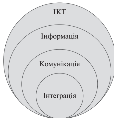
Рис. 2. Спільність інформаційно-комунікаційних технологій та інтеграції

Складною для аналізу і пошуку передумов ІП є проблема фундаментальних політичних і соціально-економічних трансформацій, особливо тих, які є результатом цивілізаційного або історичного «розвороту» політичних ідеологій, потужних світових воєн, змін суспільно-економічних формацій тощо. Через масштабність і глибину подібних цивілізаційних «розворотів» кінця минулого століття деякі країни Східної Європи й до сьогодні не завершили шлях власних трансформацій і перебудову соціально-економічних систем під нові реалії. Однією з головних причин цього є те, що подібні «розвороти» супроводжуються дією низки різноманітних негативних факторів, і найбільш недооціненим з-серед них є людський, який призводить до глибоких системних криз.