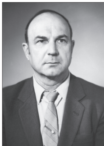
Лауреат Премії Ради Міністрів СРСР Олег Олександрович Шатагін

Сладкоштьєєв В.Т. 1952—1982 гг. 159 с.