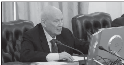
Перший віцепрезидент НАНУ В.П. Горбулін