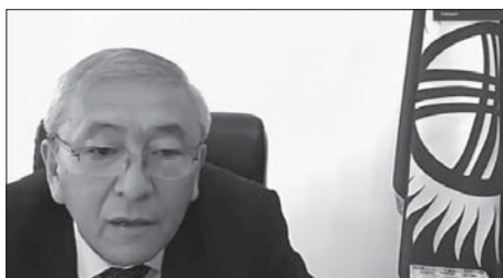
Президент НАН Киргизької Республіки М. Джуматаєв

Національної академії наук Грузії Г.І. Квесітадзе . Президент національної академії наук Киргизької республіки М.С. Джуматаєв розповів про пам'ятне для нього відвідання Б.Є. Патонам киргизької академії.