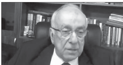
Президент НАН Грузії Г. Квесітадзе