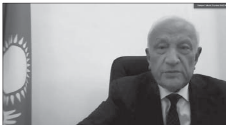
Президент НАН Республіки Казахстан М. Журинов