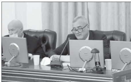
Виступ президента НАН України А.Г. Загороднього