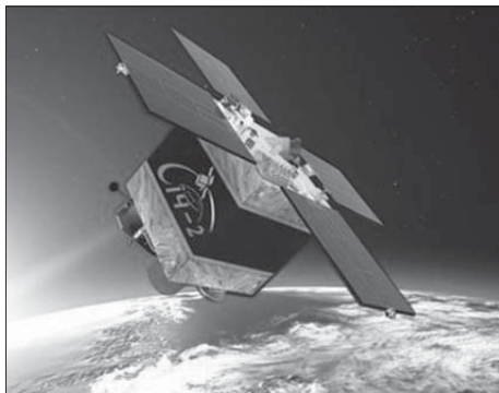
Рис. 2. Супутник «Січ-2» з оптикою, що містить CVD -композит